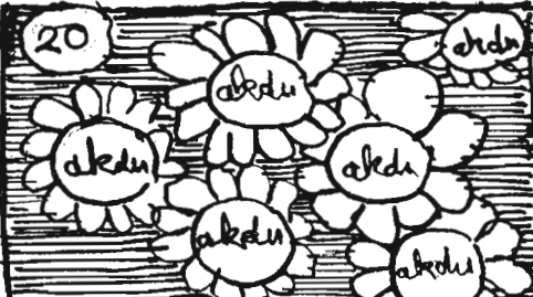
KAMPAGNE 1-2-3- VIELE AKDUS