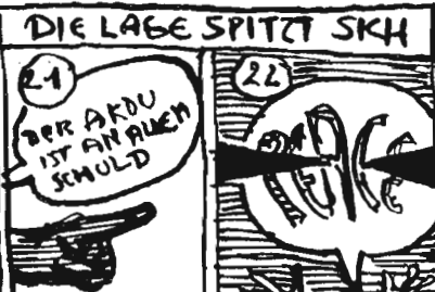
ZU IM GR. 'ORTMANN'